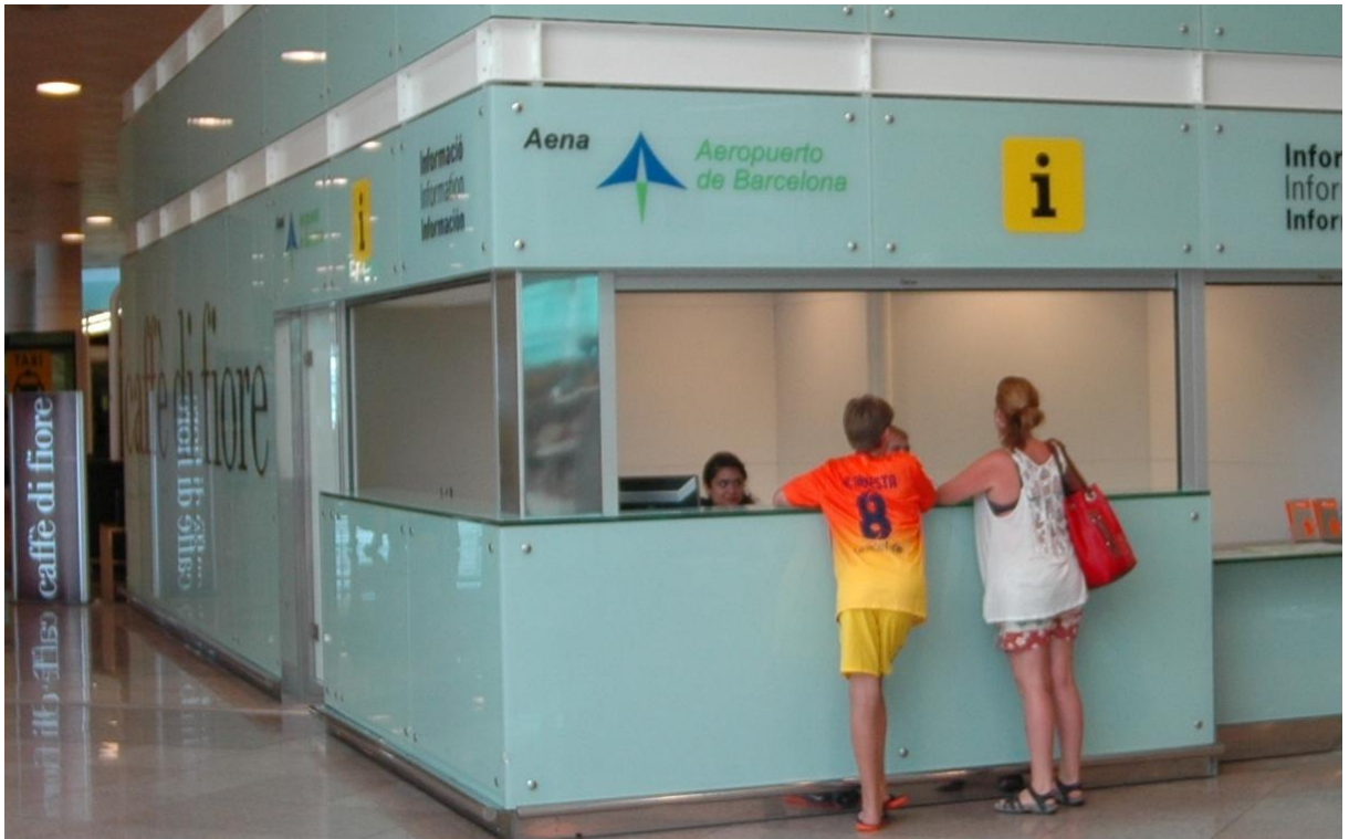
Mod. SILENCE 45-R anodizada Plata Mate