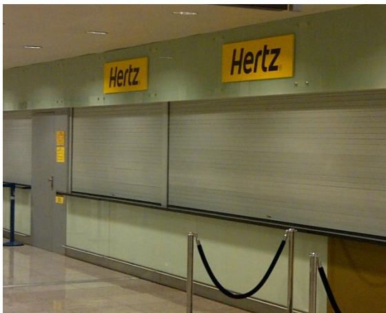
Mod. SILENCE 45-R anodizado Plata Mate