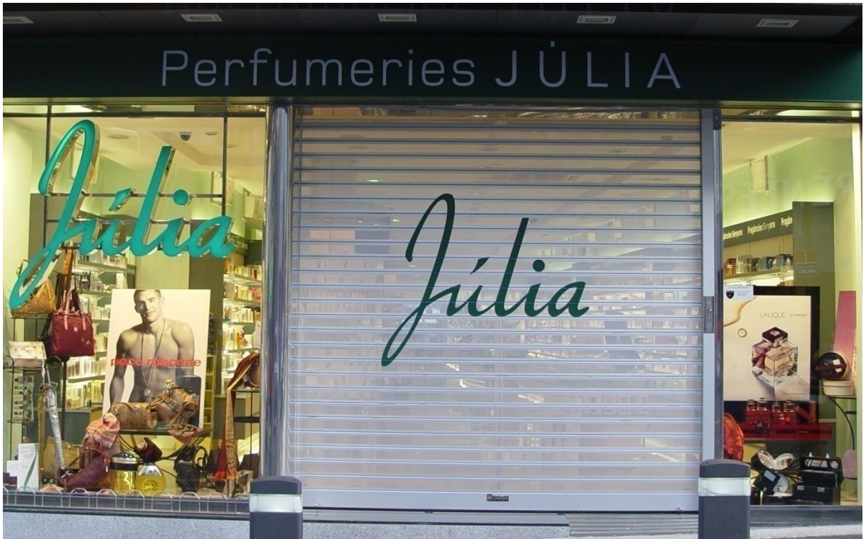
Mod. MICROPOLI Lacada Blanco RAL 9010