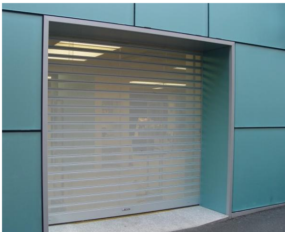
Mod. MICROPOLI anodizado Plata Mate