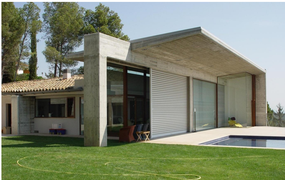
Mod. MICROBAIX anodizado Plata Mate