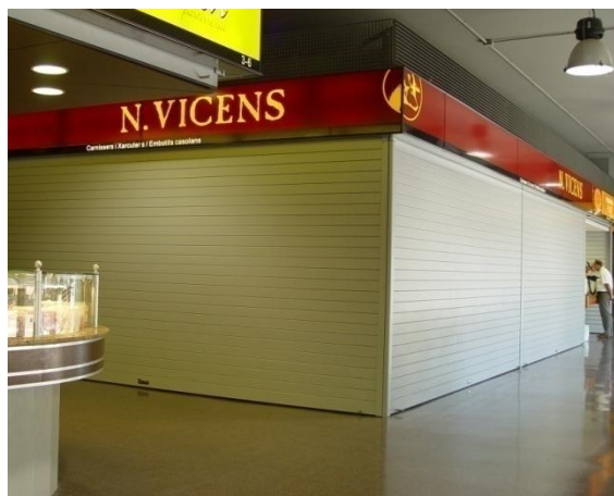
Cajón BASICBOX aluminio + Guía 95x40