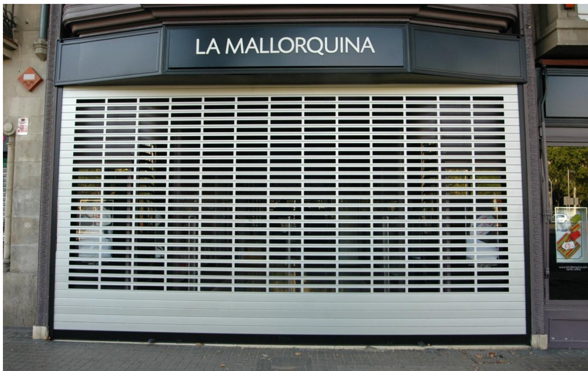
Mod. IRIS ESPECIAL Lacada RAL Gris 7012