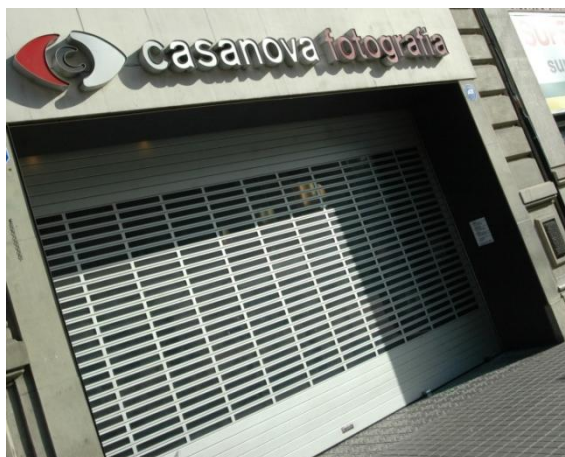
Mod. IRIS ESPECIAL Lacada RAL Gris 7012