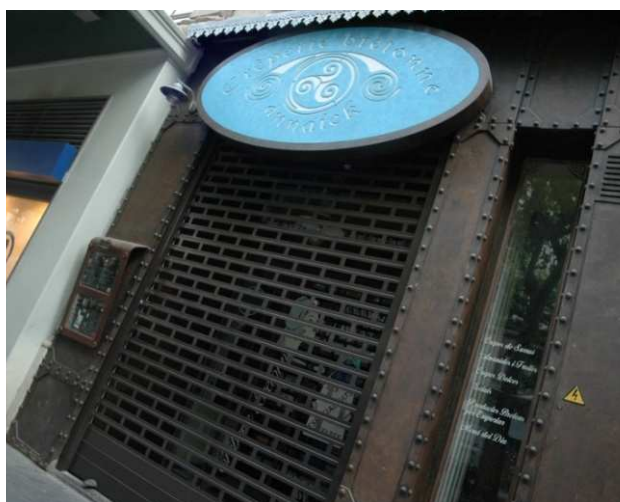
Mod. ASTRAL anodizado Plata Mate