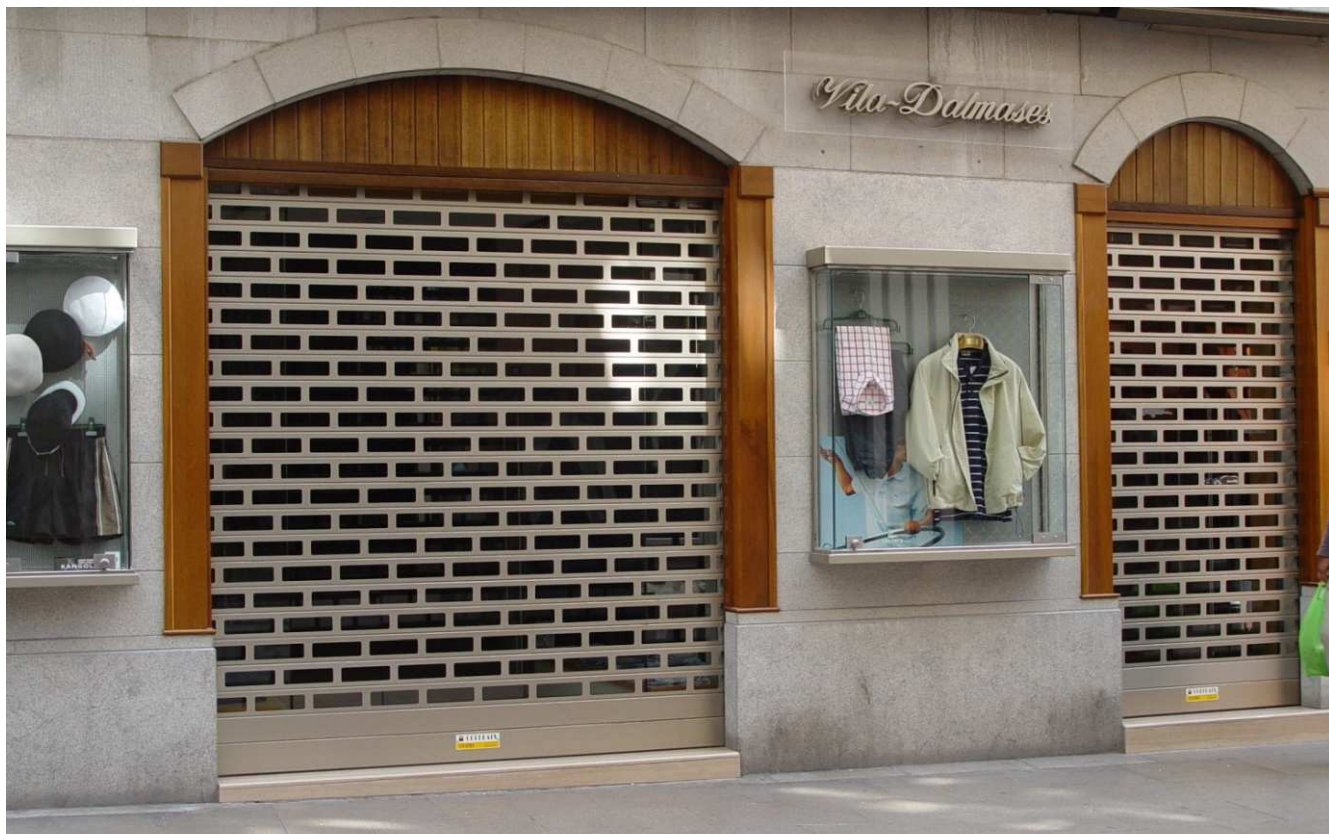
Mod. ASTRAL anodizado Inox Lij+Rep