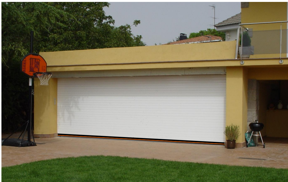
Mod. MASTER TERMIC Lacada en RAL 9010