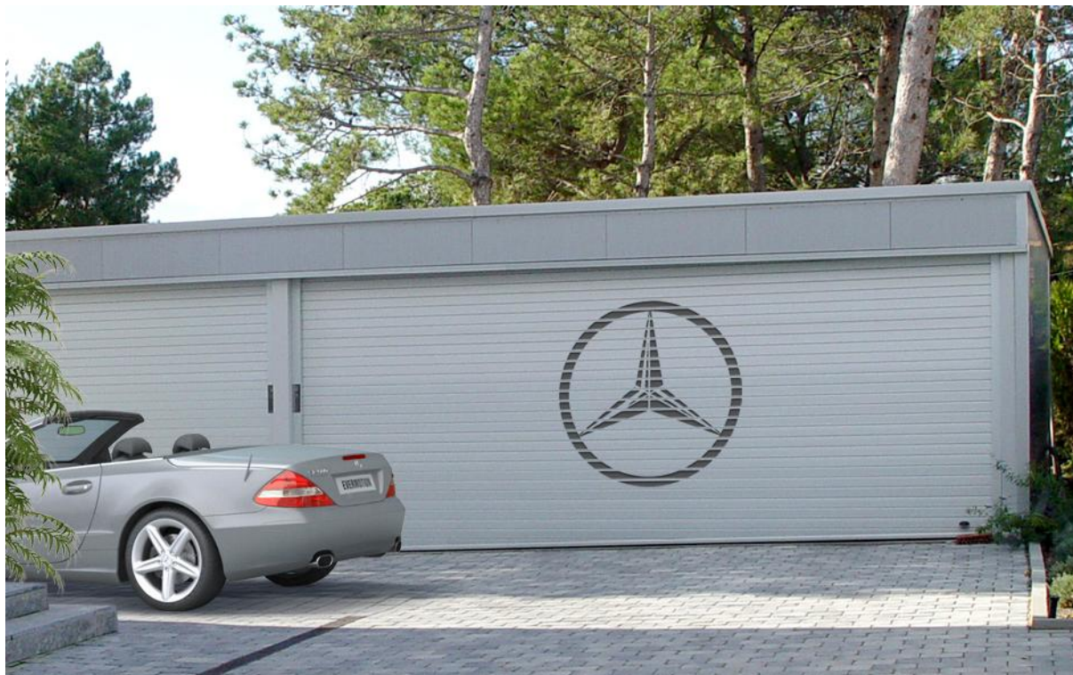
Mod. MATER DEKORA Anodizado Plata Mate